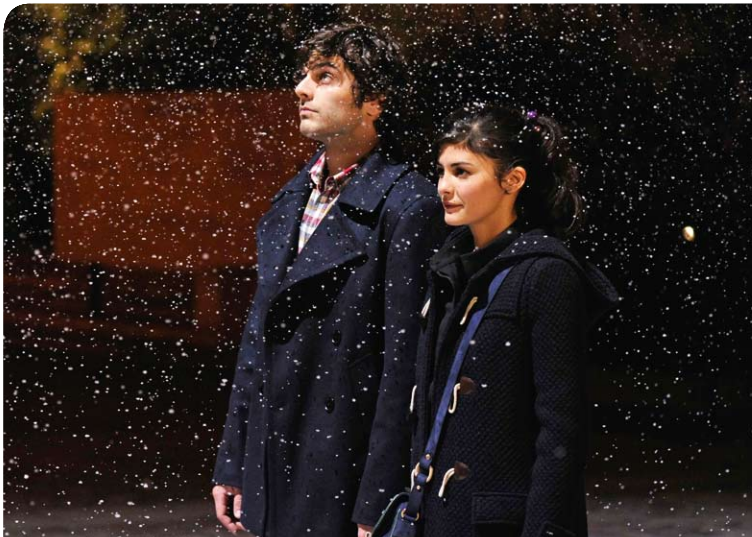
▶ L'acteur joue l'époux parfait, sensible et viril, aux côtés d'Audrey Tautou dans le film La Délicatesse , sorti en décembre dernier au cinéma.