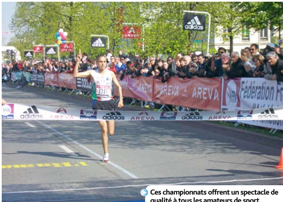
▶ Ces championnats offrent un spectacle de qualité à tous les amateurs de sport.

En ce début de printemps, la Loire se met en mode course à pied. Le 1 er avril, Roanne accueille les Championnats de France des 10 km, qui réuniront des spécialistes de cette discipline, mais aussi des amateurs. Une manifestation soutenue par le Conseil général. Alors à vos marques, prêts... Courez !