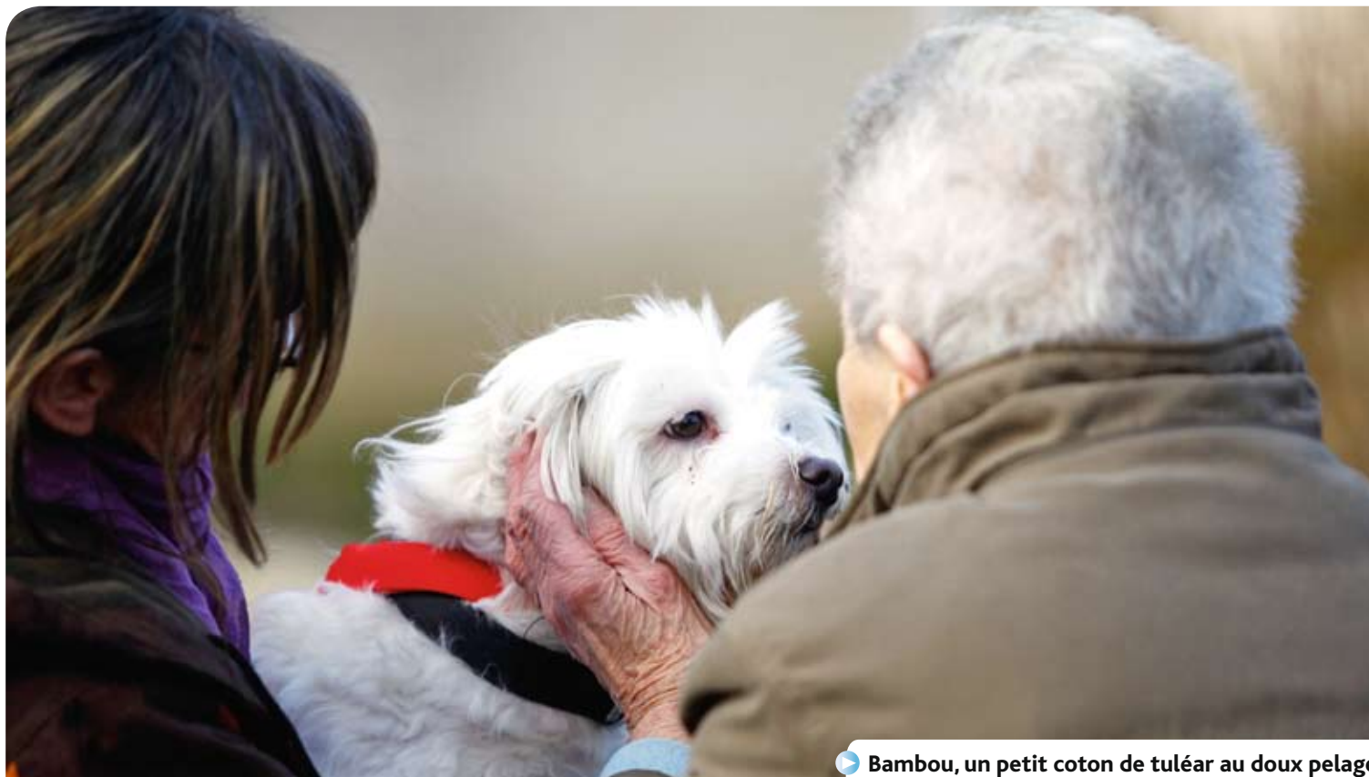
▶ Bambou, un petit coton de tuléar au doux pelage blanc, est devenu la mascotte du groupe.

Le saviez-vous ? Outre ses missions d'accueil, de soin et de placement des animaux, la Société Protectrice des Animaux (SPA) Saint-Étienne Loire intervient auprès de personnes fragiles ou en difficulté. Depuis plus de quatre ans, les personnes âgées de la Résidence Mutualiste Bernadette, à Saint-Étienne, profitent ainsi des animaux du refuge. Des rencontres très attendues aux bienfaits surprenants.