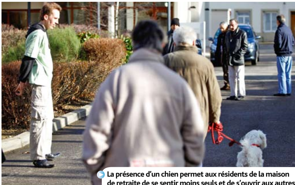
La présence d'un chien permet aux résidents de la maison de retraite de se sentir moins seuls et de s'ouvrir aux autres.