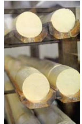
▶ Il faut 22 litres de lait pour fabriquer une fourme.