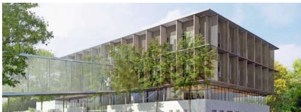
© Gauthier et Conquer (image de synthèse)

Le cancer est la première cause de mortalité en France. Pourtant, la prévention pourrait diviser par deux le nombre de décès. C'est la raison d'être du futur Centre Hygée. D'un coût total de 6,5 millions d'euros, il est financé en majorité par les collectivités, dont le Conseil général à hauteur d'un million d'euros.