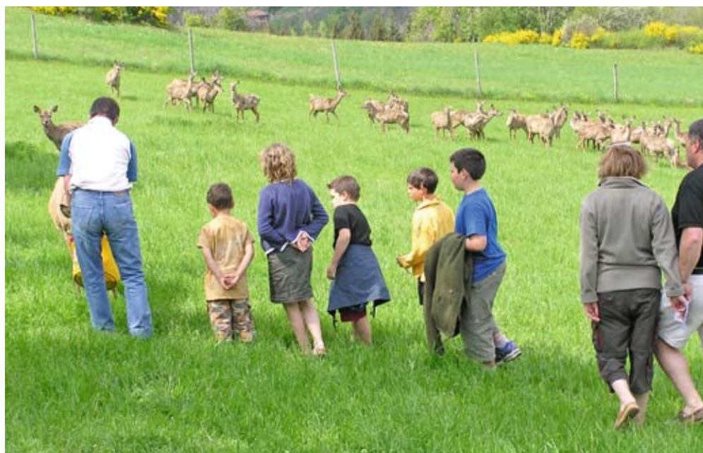
Le Conseil général de la Loire finance les journées De Ferme en ferme® à hauteur de 5 000 euros.

Visiter des exploitations agricoles tout en dégustant un apéritif artisanal ou une terrine de bison sur un bon morceau de pain au levain, c'est possible ! Les 28 et 29 avril, une soixantaine de fermes de la Loire et du Rhône vous proposent de découvrir leur production.