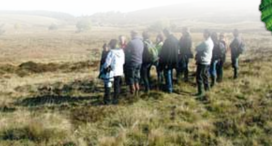
La tourbière de la Croix de Barras.

Une tourbière est une zone humide dont les conditions écologiques particulières (eau permanente, climat frais et humide) provoquent l'accumulation de matière organique sous la forme de tourbe. On les rencontre le plus souvent en altitude (Forez, Pilat, Monts de la Madeleine). Un peu comme des éponges, elles sont capables de stocker de grandes quantités d'eau, diminuant ainsi les risques d'inondation en aval. Elles restituent pour partie cette eau dans les rivières lors des périodes de sécheresse.