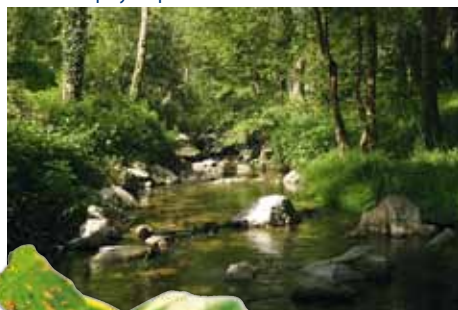
Ripisylve près du Saut de Lorette dans le Pilat.

La ripisylve est une formation linéaire d'arbres et d'arbustes étalée le long de petits cours d'eau sur une largeur d'au moins 10 mètres. Pour les rivières et fleuves comme la Loire, avec une zone boisée plus large, on parle de forêt alluviale. Ripisylves et forêts alluviales jouent un rôle-clé pour purifier l'eau en fixant ou en transformant les polluants qu'elle contient.