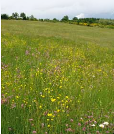
Une prairie humide en fleurs.