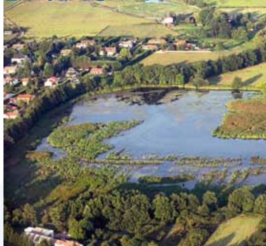
L'étang de la Ronze.

La végétation est constituée le plus souvent de plantes aquatiques, de laïches et de roseaux, adaptés à des variations de niveau de l'eau.