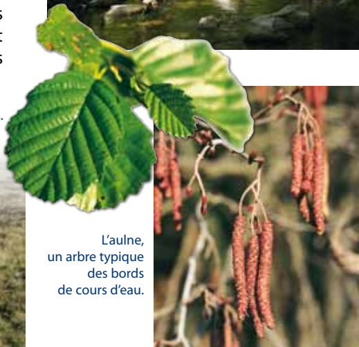
L'aulne, un arbre typique des bords de cours d'eau.