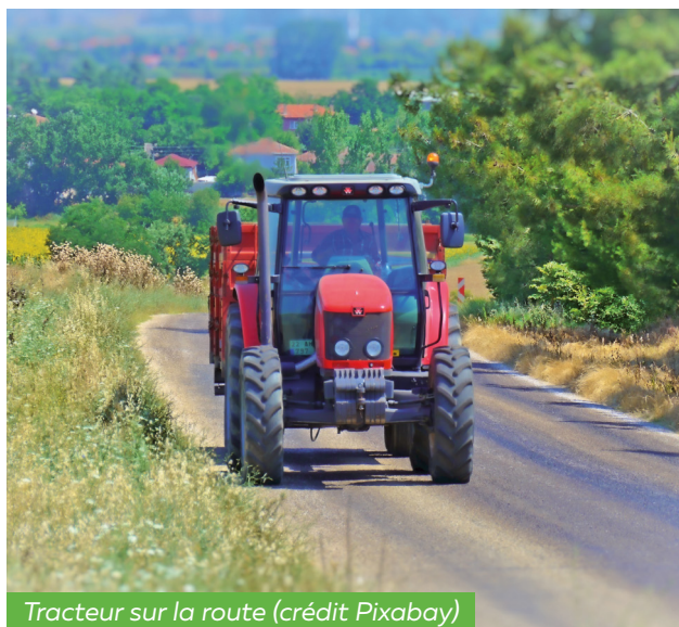
Tracteur sur la route (crédit Pixabay)