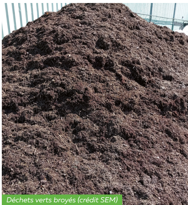
Déchets verts broyés

Malgré un contexte très perturbé par la crise sanitaire, de nombreuses actions structurantes pour les exploitations agricoles du secteur ont été menées cette année.